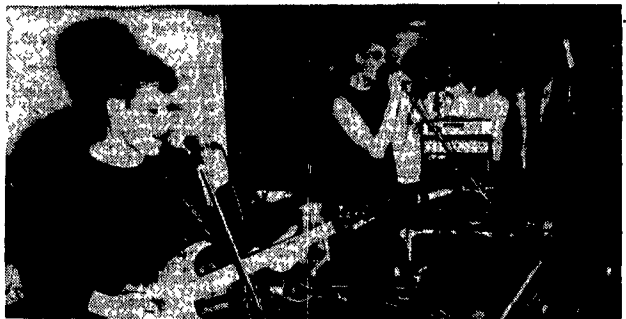
Gli «Shamen» in concerto venerdì notte all'Uonna club