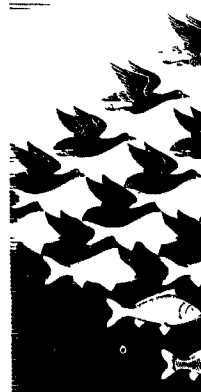
Una incisione di Mauritz C. Escher