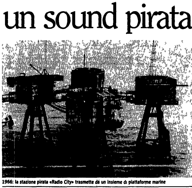
1966: la stazione pirata «Radio City» trasmette da un insieme di piattaforme marine

Il fenomeno non è solo commerciale ma culturale tanto che ha dato vita ad una nuova musica