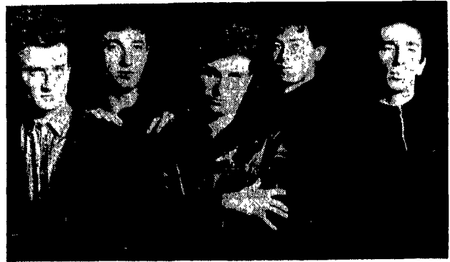
«Hot Riviera», uno dei migliori gruppi rock romani

no cambiati, sulla testa un copricapo di piume, dietro la gente del villaggio indiano. Strane incomprensibili parole pronunciate, una litania indiana che accompagnava la strana processione nel giro dell'altipiano tra i morti. John trasformato in «Falco che vive lontano» il capo sioux, l'ultimo, che ogni ultima domenica del mese torna per pregare insieme alla sua gente i propri morti. Avevano sentito in città questa storia, che loro pensavano, una delle tante leggende sugli indiani. Durante la marcia di ritorno nessuno parlò, ogni tanto uno dei tre si voltava verso la collina, quasi a pensare qualcosa da dire l'indomani a «John-Falco che vive lontano», o forse solo a vergognarsi un po' di avere la pelle bianca. Mentre tornavano in città il sole ormai calava, ponendo la parola fine anche a questa ultima domenica del mese, disegnando, con i suoi rossi raggi, strani tratti sulle colline che da est dominano la città.