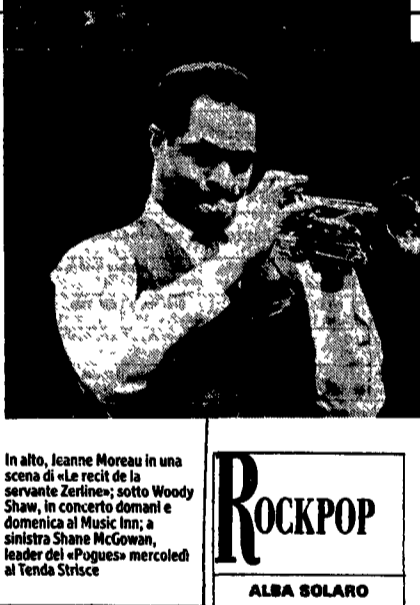
In alto, Jeanne Moreau in una scena di «Le recit de la servante Zerkine»; sotto Woody Shaw, in concerto domani e domenica al Music Inn; a sinistra Shane McGowan, leader del «Pogues» mercoledì al Tenda Strisce