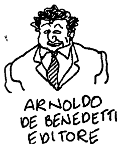
ARNOLDO DE BENEDETTI EDITORE

CON LA MONDADORI SI FOTTE' META DELLA REPUBBLICA, L'ALTRA META' GIA' LA CONTROLAVA CON L'ESPRESSO