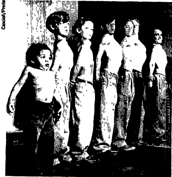
Gli studenti col fiato sospeso

SE VOI FOSTE UN MAFIOSO E AVESTE 100 MILIARDI DA INVESTIRE, DOVE LI METTERESTE?