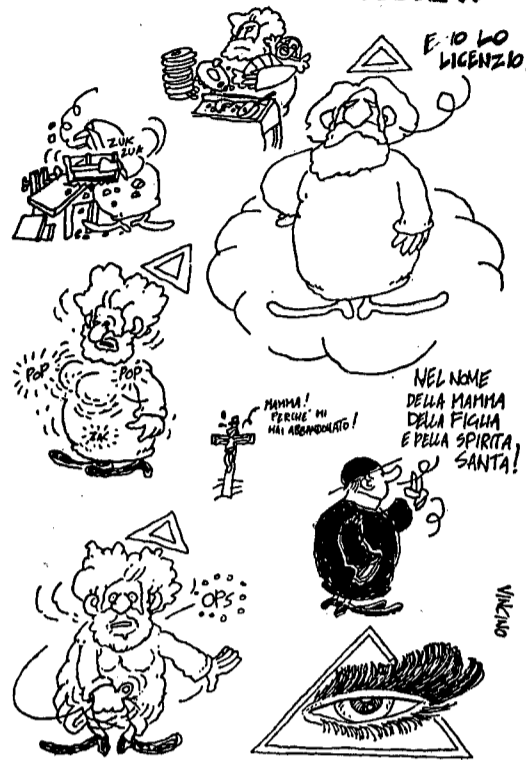
Vincino, Il Male 1978.