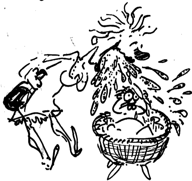
Reiser, «Viva le donne!», Bompiani 1978.