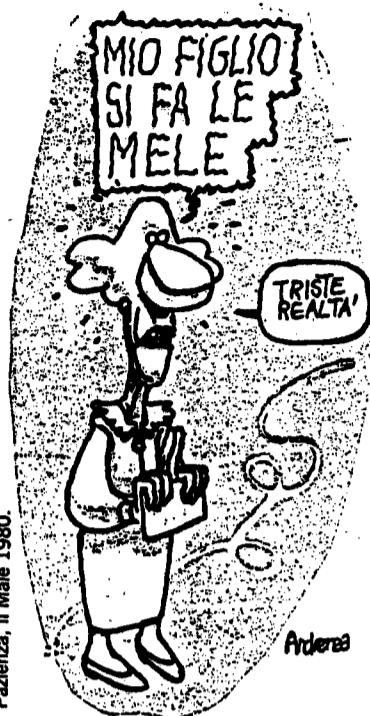
Pazienza, Il Male 1980.