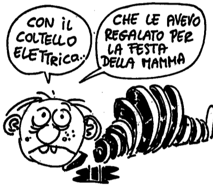
Reiser, «Viva le donne!», Bompiani 1978.