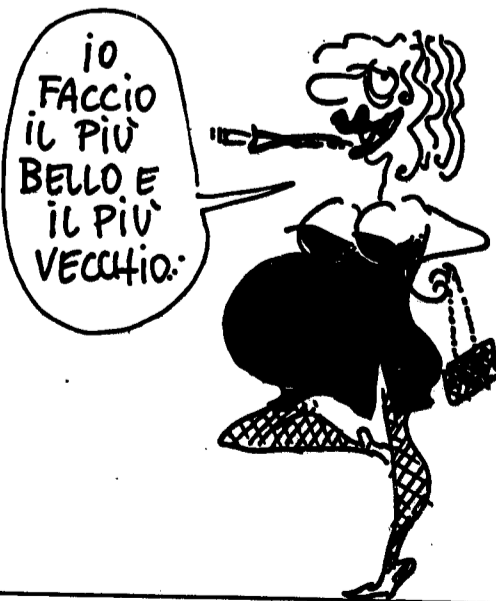
Reiser, «Viva le donne!», Bompiani 1978.