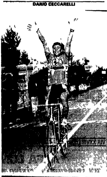
Maurizio Fondriest: braccia al cielo anche nel prossimo Giro?