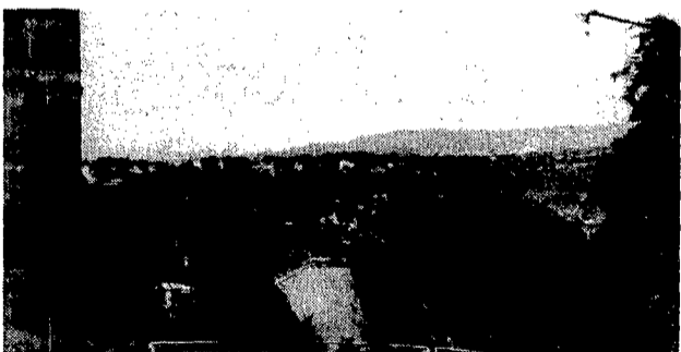
Un'immagine del lago di Albano

Trentamila abitanti, Albano è da quattordici anni amministrato da una giunta di sinistra guidata dai comunisti. Gli elettori dovranno ora giudicare l'operato dell'amministrazione che secondo l'ex sindaco può essere considerata positiva.