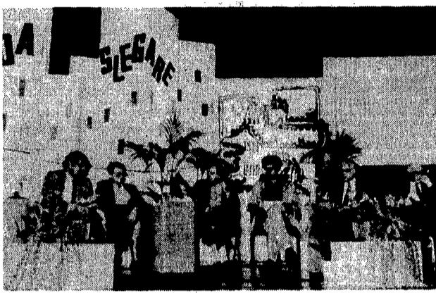
Il sindaco incalzato dribbala reale. Non ci si può però nascondere dietro un dito, dimenticando la paralisi del Comune, dovuta al fallimento del pentapartito...

«Un governo debole del Comune? Colpa delle leggi nazionali che imbrigliano la nostra azione», dice Signorello. Rispondono i comunisti «La vostra è una scelta per favorire i potenti dell'economia e della finanza».