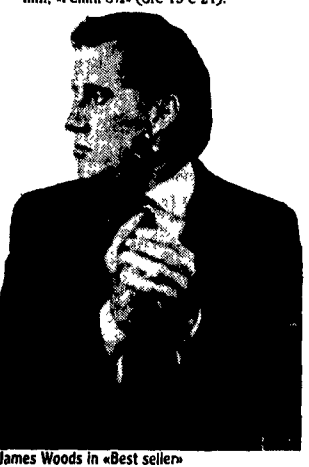
James Woods in «Best seller»

Musica nelle scuole. Stasera, ore 20, Interno, lire selmilia. Suonano i Scrambled Eggs, Midnight Special, Clima e Hot Riviera.