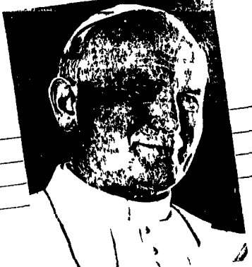
Juan Pablo II Peregrino de la Paz