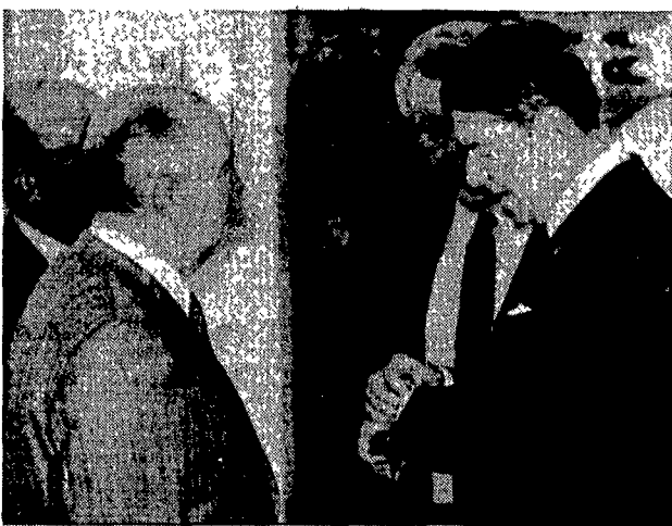
Gorbaciov e Reagan pochi minuti prima di prendere posto al tavolo del vertice»