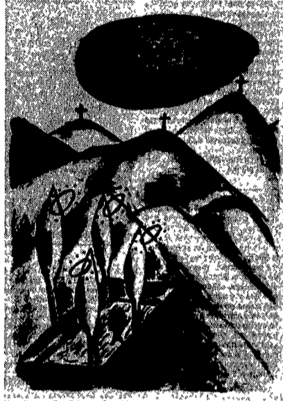
Una litografia di Enzo Cucchi

Enzo Cucchi. Galleria Stamperia 2RC, via de' Dellini 16, fino al 30 giugno; ore 11-13 e 17-19.30. Famoso come pittore di Transavanguardia, Enzo Cucchi a me pare un trasgressore nei confronti del "clima" e della cultura, e un tempo primordiale e onnivoro, del gruppo portato alle stelle e al mercato internazionale da Achille Bonito Oliva. Prima che pittore, Cucchi è un drammatico disegnatore con un poderoso senso del nero, macchia e segno, che volge sempre a un'immaginazione cupa, minacciosa e lubre. L'immagine è un'immagine di morte, di angoscia, di figure scheletriche, tessi e croci, stridine sconesse che non si sa dove finiscono tra colline brulle che sembrano spesso ricordare il movimento delle colline marchigiane intorno a Jesi.