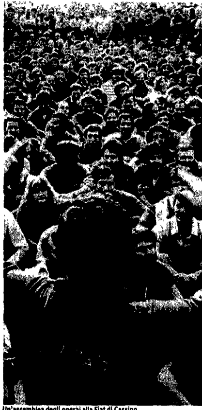
Un'assemblea degli operai alla Fiat di Cassino

Un calo ancora più sensibile Nelle città delle fabbriche il Pci perde di più vanno avanti i socialisti