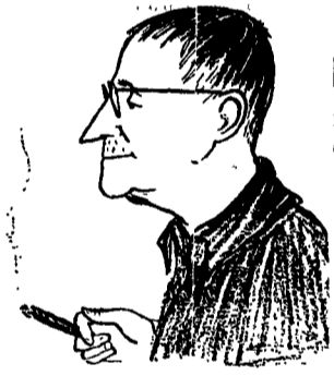
Una caricatura di Bertold Brecht

Accademia. Saggio degli allievi del III anno dell'Accademia Nazionale d'Arte Drammatica «Silvio D'Amico» che, diretti da Roberto Guicciardini, si cimentano nello spettacolo Perché l'uomo di fumo di Aldo Palazzeschi (la elaborazione scenica è sempre di Guicciardini). L'appuntamento è al Teatro Sala Umberto (Via della Mercede 50) lunedì e ore 21. Repliche fino al 19.