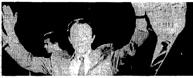
Michel Rocard a Parigi durante la campagna elettorale