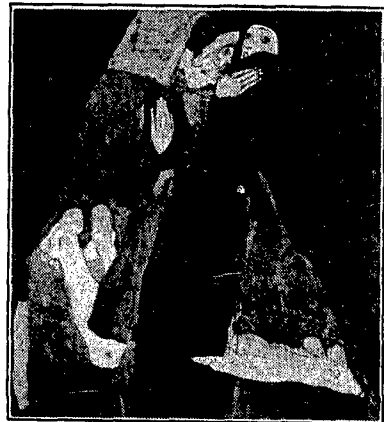
TULLIO PIRONTI EDITORE

Esorcismo, amori proibiti, una storia vivacissima raccontata con stile di scrittura scorrevolissimo e avvincente.