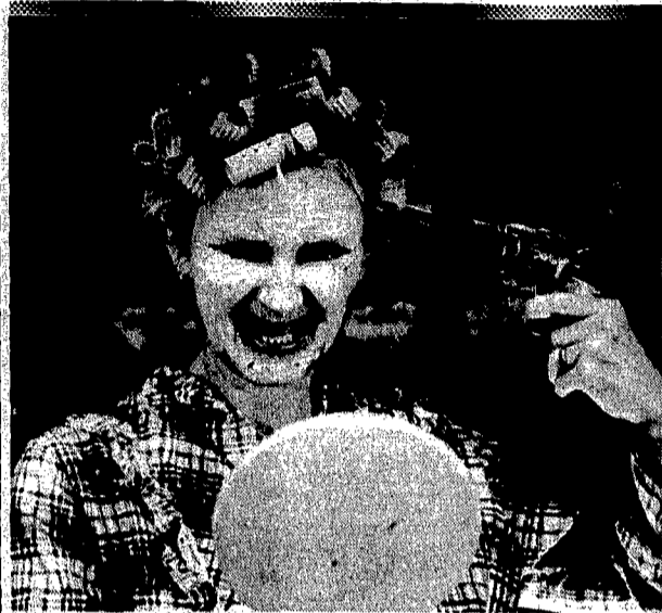
CASA BIANCA. Nancy Reagan felice per l'arrivo dei coniugi De Mita

«...che risate ci siamo fatti Reagan ed io: lui mi ha raccontato delle barzellette divertentissime, io gli ho raccontato che resterò presidente del Consiglio fino al 1992...»