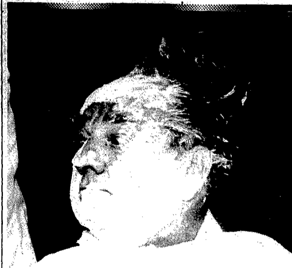
WASHINGTON. De Mita ad una colazione di lavoro dopo il dessert

«...al momento della partenza Reagan ha espresso la sua soddisfazione per la visita, mi ha raccomandato di tornare e magari di far venire con me anche il presidente del Consiglio...»