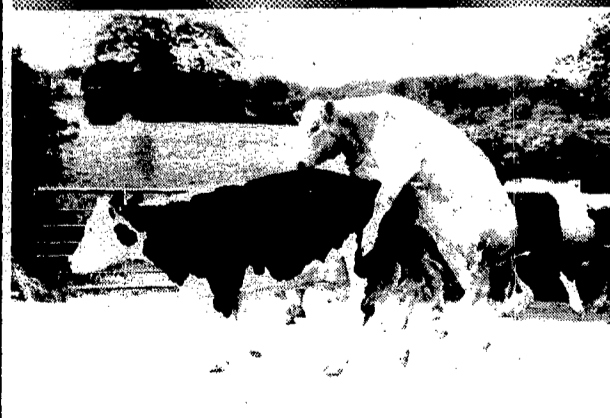
Gary Hart (a destra nella foto) mentre aspetta di conferire con De Mita

«...al momento della partenza Reagan ha espresso la sua soddisfazione per la visita, mi ha raccomandato di tornare e magari di far venire con me anche il presidente del Consiglio...»