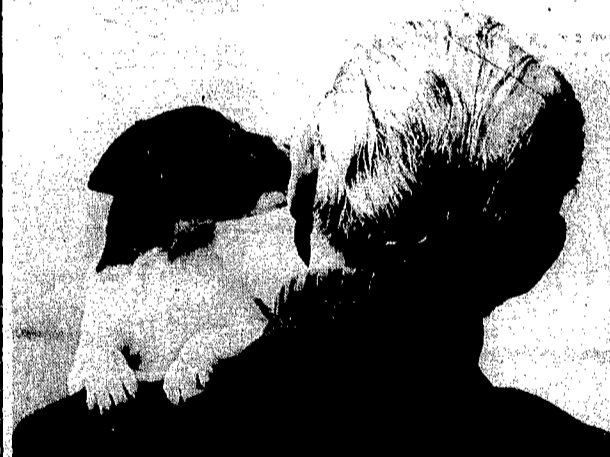
De Mita confida a Kissinger le sue preoccupazioni riguardo agli F16

«...mentre io parlavo con Reagan, Andreotti discuteva con Shultz e Gava con Lucky Luciano...»