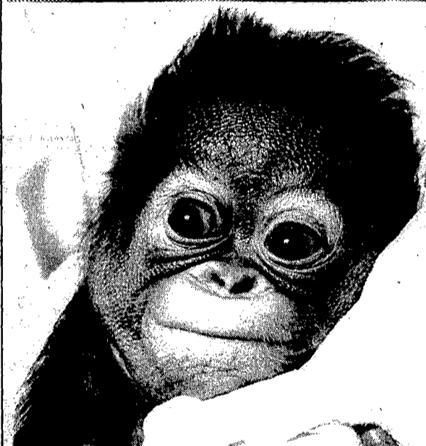
WASHINGTON. Robert Redford dopo un'ora di conversazione con il nostro presidente del Consiglio