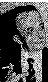
Tullio De Mauro