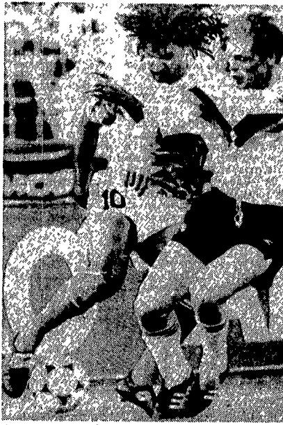
Gullit contrastato da Borowka

ni: parliamo di Matthaeus, ieri peraltro non al massimo, di Thon, forse di Kohler e sicuramente, per quello che ha fatto contro l'Olanda di Klinsmann.