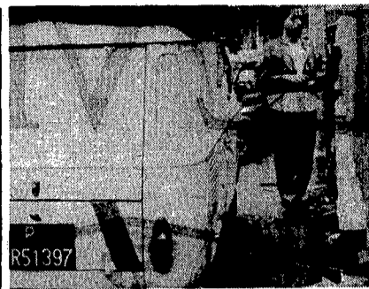
Il furgone usato dai rapinatori