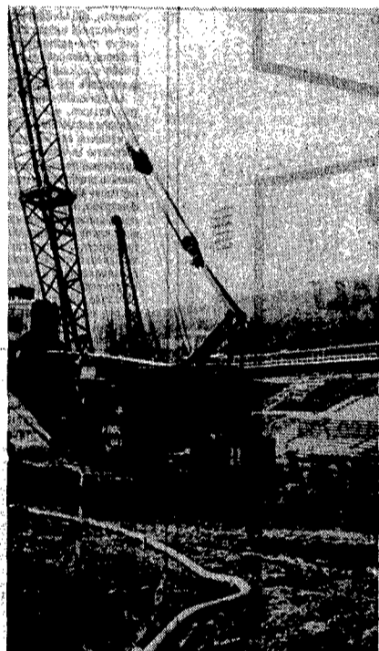
Un particolare dei lavori in corso allo stadio Olimpico; sopra il titolo una panoramica dei cantieri

munisti - il bilancio non è approvato, per i fondi Fio ci vuole un anno e i 250 miliardi per Roma capitale devono essere usati per l'acquisizione pubblica di parte delle aree, per le progettazioni, per le infrastrutture dello Sdo. Secondo Pietro Giubilo invece i fondi non sono un problema: «Ci sono 110 miliardi previsti dal piano di investimenti 87-89 già approvato dal consiglio comunale, i 250 miliardi per Roma capitale possono essere utilizzati perché c'è un impegno del ministro Carlo Tognoli per il rifinanziamento della legge, e per quanto riguarda i fondi Fio possono essere anticipati con il ricorso alla Cassa depositi e prestiti». L'accesso alla Cassa depositi e prestiti è vincolato per legge a delibere del consiglio (che quindi può sindacare il merito delle scelte), ma il decreto del governo consentirà di accedere ai finanziamenti solo con una delibera di giunta. Si può arrivare al paradosso che una giunta in ordinaria amministrazione, che non è sostenuta da una maggioranza in consiglio, prenda per Roma le decisioni più importanti della sua storia recente.