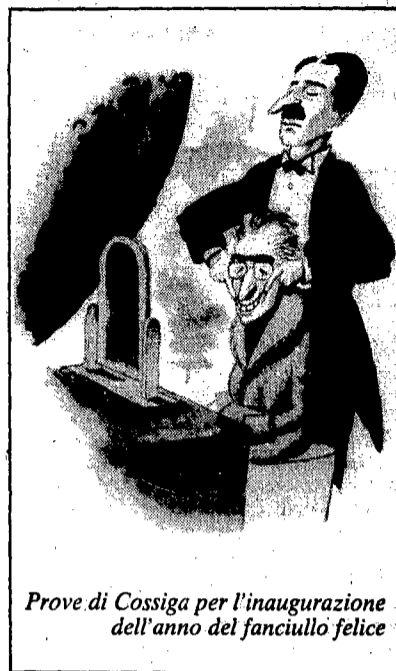
Prove di Cossiga per l'inaugurazione dell'anno del fanciullo felice

«COSSA C'ENTRI L'ALLEGRIA CON COSSIGA NON L'HA CAPITO NESSUNO...»