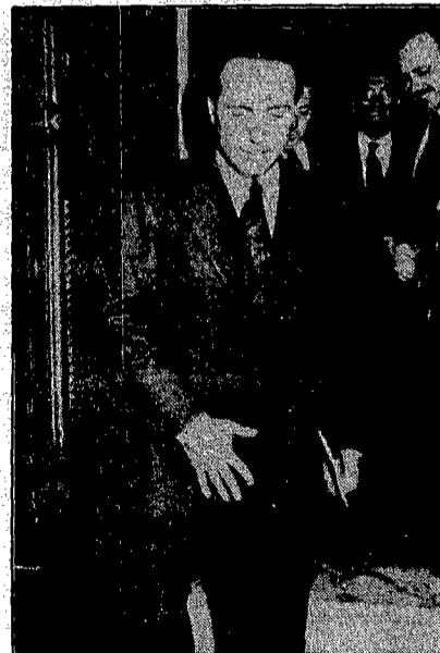
Berlusconi il giorno che riuscì a mettere le mani su Pippo Baudo