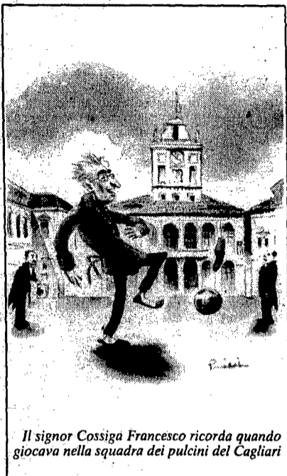
Il signor Cossiga Francesco ricorda quando giocava nella squadra dei pulcini del Cagliari

▼ Tre pagine tratte da «Il signor Cossiga Francesco». Tra 15 giorni nelle Rinascita, nelle Feltrinelli e nelle migliori librerie