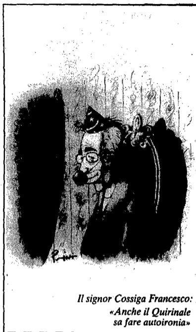
Il signor Cossiga Francesco: «Anche il Quirinale sa fare autoironia»

«ALL' USCITA CI HANNO REGALATO IL REPRINT DI "ALLEGRIA" DI UNGARETTI...»