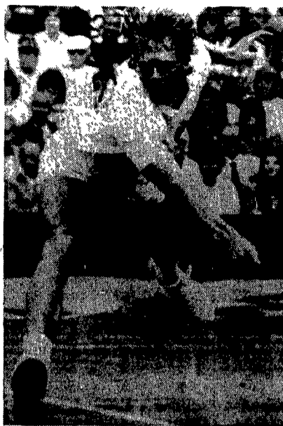
Stefan Edberg in finale a Wimbledon