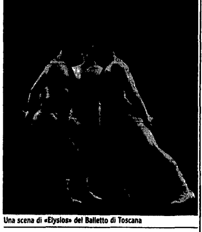
Una scena di «Elysios» del Balletto di Toscana

Gades (13 luglio) ci riporta a più caldi temperamenti con la sua appassionata Carmen, mentre la compagnia Red Notes si cimenta in un repertorio tra classico e moderno. Prima comparsa a Roma sotto le nuove vesti di Iso (l'm so optimist) degli ex simpatizzanti Moxix (15 luglio). Il 17, poco superstitiosamente, si esibisce la compagnia americana The Feld Ballet con coreografie di Eliot Feld che ne è il fondatore.