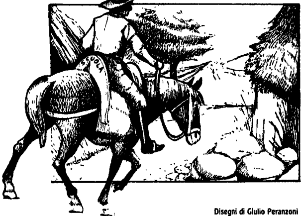
Disegni di Giulio Peranzoni