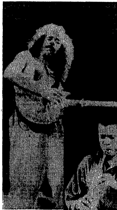
Carlos Santana si presenta in un insolito «duo» con Wayne Shorter (a centro). A destra, l'altro big Bobby McFerrin