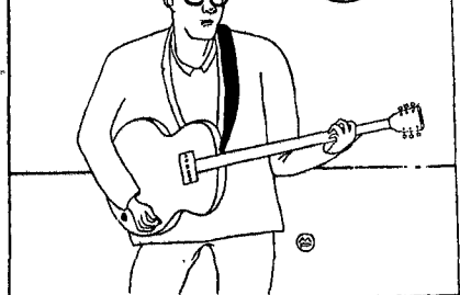
Un disegno di Marco Petrella

Oltre il giardino. L'architettura del giardino contemporaneo: settanta pannelli e sei film. In/Arch, via di Monte Giordano 36. Ore 9-13 e 17-20, sabato e domenica chiuso. Fino al 28 ottobre.