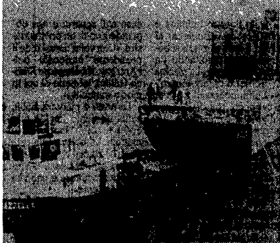
La fregata Usa danneggiata nell'aprile scorso da una mina iraniana