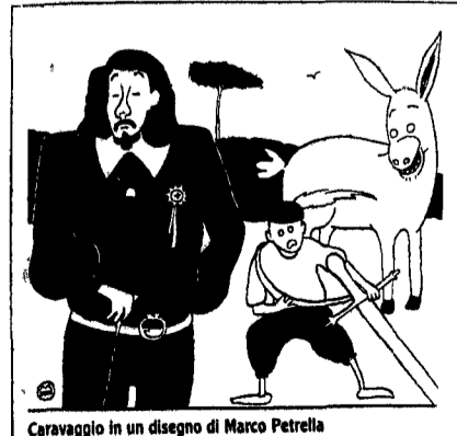
Caravaggio in un disegno di Marco Petrella

Satana! Voleggiano spiriti, folletti, spiritelli, elfi, a gara con i mostri zannuti e deformi, tra le mille saette della notte, tra la cascata di faville, scintillante sintonia che non illumina il nero della notte. Voleggiano e tutti si inchinano reverenti al maligno che avanza, orrido ed altezzoso signore della notte.