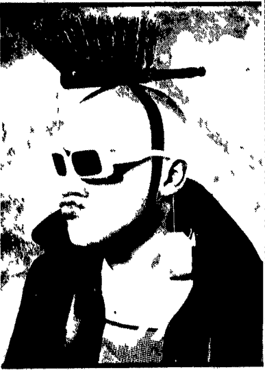
Il noto presentatore con il nuovo modello di paracchino per non farsi riconoscere dai rapitori