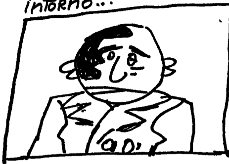
GORBACIOV: UNA MACCHIA di vino, con UN RUSSO INTORNO...