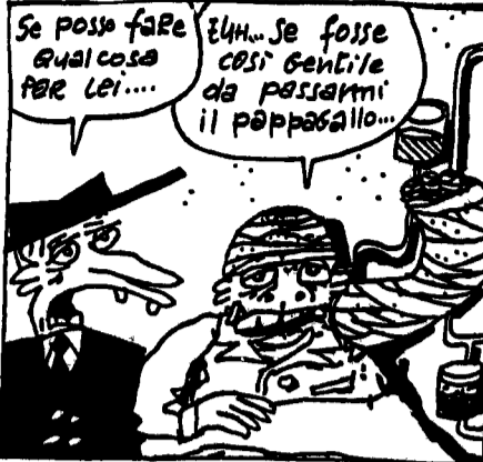
TERRORE: Mitterrand visita le vittime