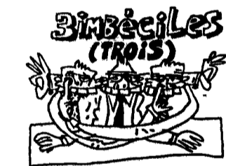
JACQUES CHIRAC CAMBIA GLI SLIP TUTTI I GIORNI!

Per chi fosse interessato informiamo che il costo di ogni cassetta è di 150 franchi (circa trentamila lire), e che queste possono essere richieste a «Imbeciles Associés», 44 rue Henry Deglin, 54000 Nancy.