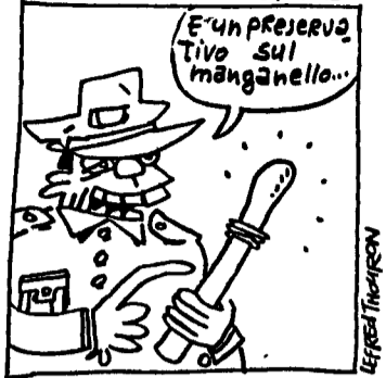
I poliziotti vogliono portare i guanti per proteggersi dall'AIDS