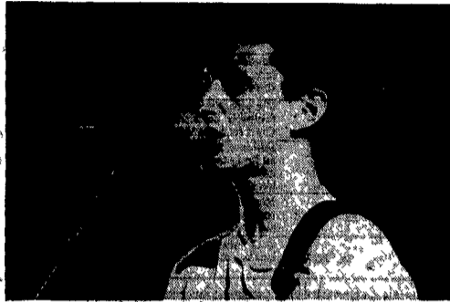
Billy Bragg in concerto stasera a Castel S. Angelo in compagnia del «Gang»