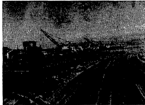
Lavori in corso nella piana di Gioia Tauro