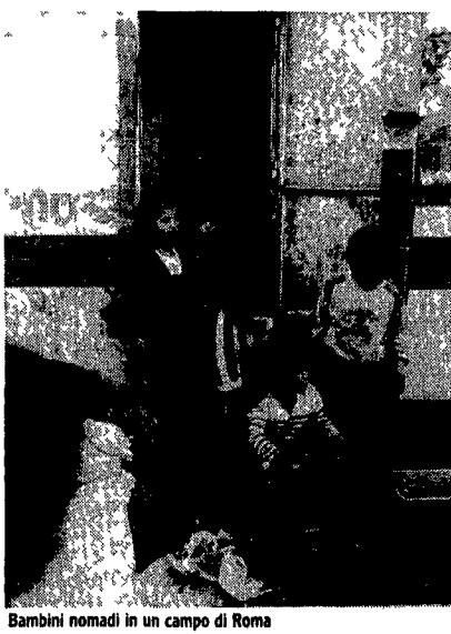
Bambini nomadi in un campo di Roma