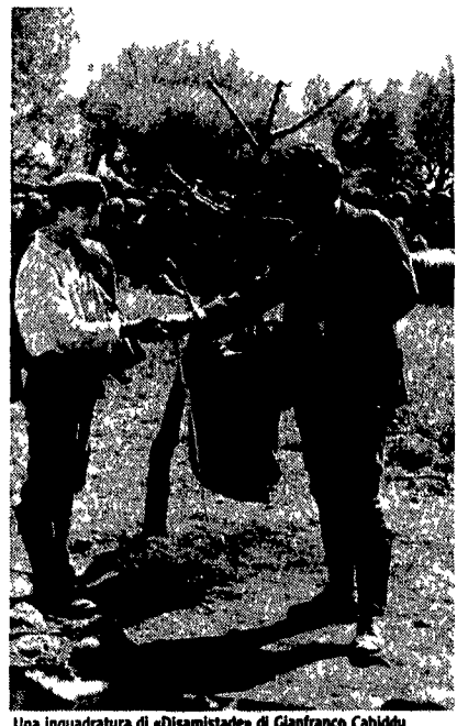
Una inquadratura di «Disamistade» di Gianfranco Cabiddu

senza tuttavia riuscire ad odia re «Non sa più colpire con la mano dei padri non può ancora smettere di colpire».