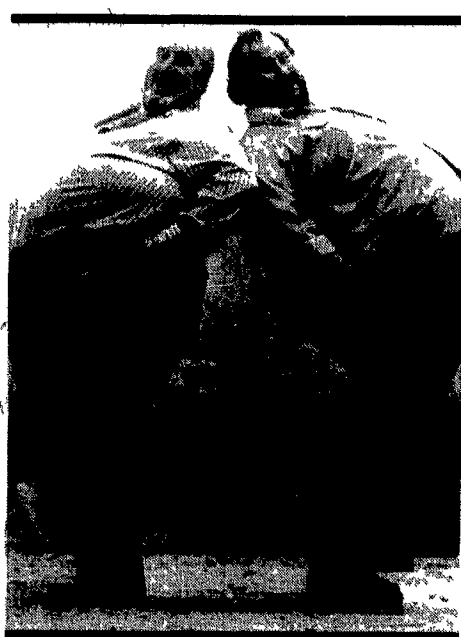
Alla festa di Tango di Montecchio si mangia bene