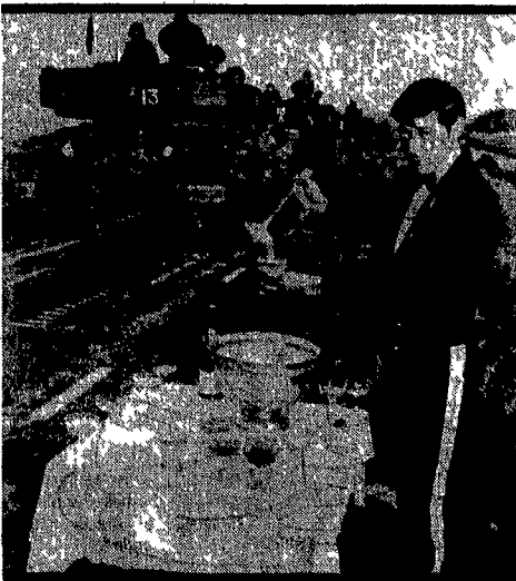
Montecchio, un paese ospitale che dà il suo benvenuto a chiunque

ore 21,30 «Nuovo razzismo una sfida alla democrazia», incontro con L. PINTOR, p. E. BALDUCCI e M. SERRA ore 23 Il cabaret della «GERUSALEMME LIBERATA»