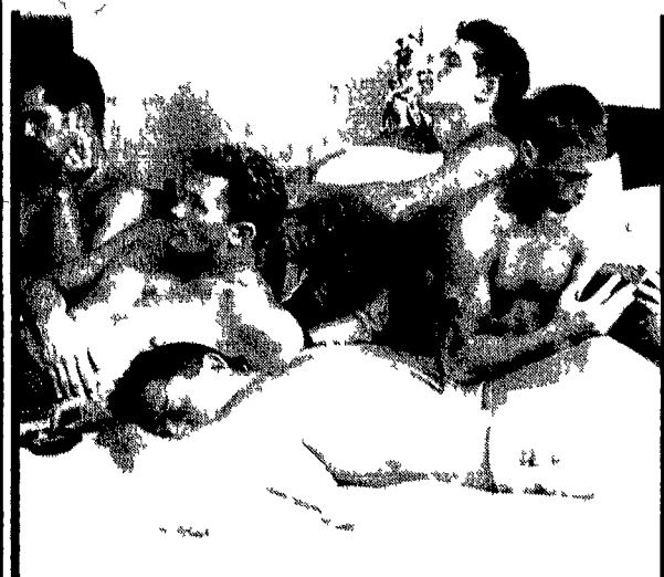
Frenetica mobilitazione della Fgci per la preparazione della festa