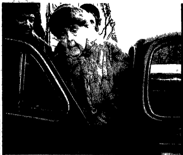
Il segretario del Pci di Montecchio che ha fatto la sua fortuna con le feste di Tango

Terza festa nazionale di Tango, dal 23 al 31 luglio 1988