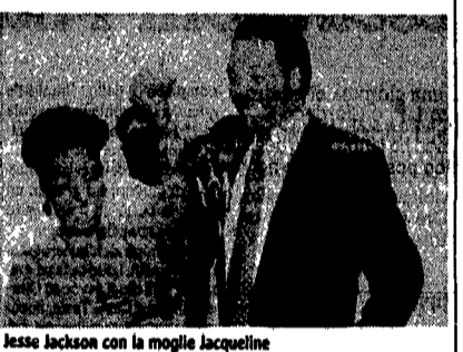
Jesse Jackson con la moglie Jacqueline