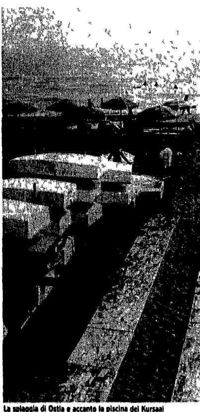
La spiaggia di Ostia e accanto la piscina del Kursaal

SCAURI ARENA VITTORIA Tel 0771 20758 Stati di alterazione progressiva (21 23) MINTURNO ARENA ELISEO Via Appia Tel 0771 683688 L. 4.000 Streghe di Hitchcock (20 30 22 30) ANZIO MODERNO Piazza della Pace 5 Tel 9944750 L. 5.000 Non parvenuto S. MARINELLA ARENA LUCCIOLA Via Aurelia Tre sottoposti e un bebè ARENA FRIGUS Via Garibaldi Senza via di scampo