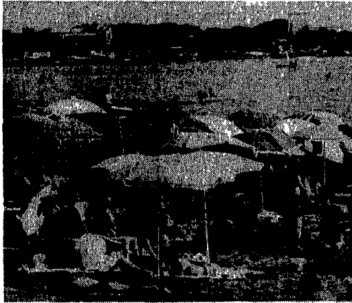
Qui a destra le palme piantate sulla passeggiata del lungomare di Tarquinia. A sinistra un'immagine della spiaggia che rimane ancora abbandonata

TARQUINIA. E le palme da dove sono spuntate? L'interrogativo si ripropone ad ogni arrivo dei villeggianti abituali che hanno appena lasciato le accaldate campagne del Viterbese per trovare refrigerio al Lido di Tarquinia. Sì, perché la stretta fetuccia d'asfalto, che accompagna senza troppa fantasia i tipi più diversi di costruzioni (bruttine) e la spiaggia, sembra proprio un'altra cosa rispetto agli anni passati. «Non che il lido abbia perso del tutto l'aspetto di una disordinata periferia - dicono i più esigenti - ma almeno con queste belle piante sembra di stare davvero in un posto di vacanza». Alte, robuste, imponenti, accarezzate dalla brezza, le tredici palme si seguono a distanza regolare per un buon tratto del marcia piede che costituisce la passeggiata a mare di Tarquinia. A due passi inizia la spiaggia e si rincorrono le cabine, i cam-