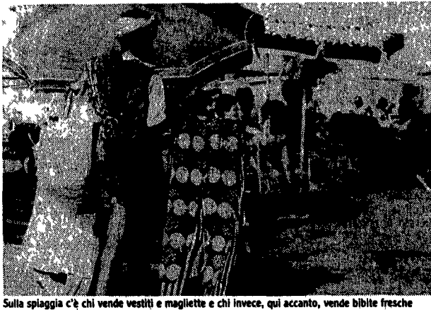
Sulla spiaggia c'è chi vende vestiti e magliette e chi invece, qui accanto, vende bibite fresche