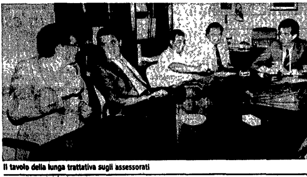
Il tavolo della lunga trattativa sugli assessorati

Accordo per la giunta Si discute l'organigramma ma il Pri s'impunta e chiede deleghe «forti» Stasera consiglio comunale Dibattito sulla crisi Domani mattina si vota il nuovo sindaco