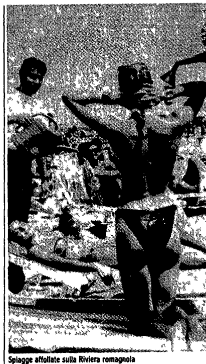
Spiagge affollate sulla Riviera romagnola

NAPOLI Proteste e tentazioni per un nuovo sciopero proclamato a partire da ieri, a tempo indeterminato, dai pendenti della cooperativa di battellieri che cura il servizio di trasporto dei visitatori all'interno della Grotta azzurra di Capri.