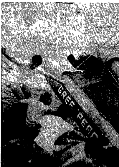
Due momenti dell'operazione «Bucaniere» condotta dai militanti di Greenpeace...

La Nocetta. Associazione sportiva di via Silvestri 16, tel. 62.58.952 e 53.11.102. Piscina scoperta. Labbramento mensile è di lire 70.000 più iscrizione Scuola di nuoto.