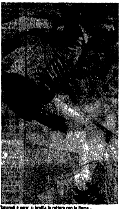
Tancredi è nero: si profila la rottura con la Roma...