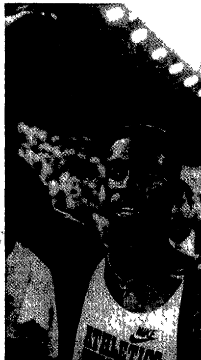
Carl Lewis raccoglie a braccia levate l'applauso del pubblico, mentre Reynolds alza il pugno in senso di potere e di forza, dopo il suo fantastico record.