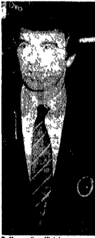
Zoff esordio ufficiale

Prime verifiche sul campo Ad Arezzo la Samp regina d'estate Il Milan affronta il Licata l'Inter a Parma, la Roma a Prato