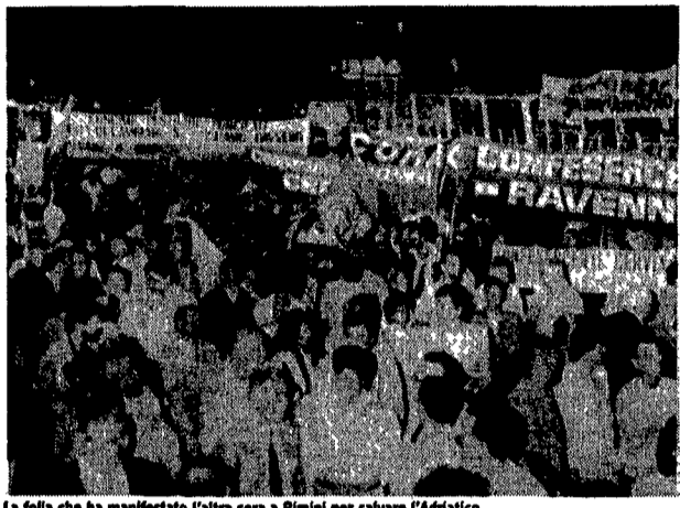
La folla che ha manifestato l'altra sera a Rimini per salvare l'Adriatico