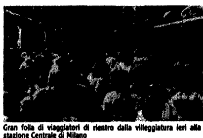
Gran folla di viaggiatori di rientro dalla villeggiatura ieri alla stazione Centrale di Milano

ROMA «È inconcepibile che amministratori e parlamentari che premono per avere le industrie si mettano poi a guidare i cortei contro le discariche».