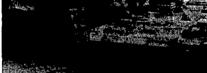
Uno scorcio di folla passeggia per i viali della Festa. In alto lo stand addetto a libreria

credere a una conversione in teatralità del partito di Loris Fortuna - fa Enrico Francheschini robusto grossotto - è machavelismo machavelismo puro»