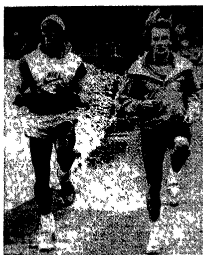
Il boss e la... rock-star. C'è chi si allena correndo e ascoltando musica dal «walkman». Frank Bruno lo sfidante inglese alla corona dei massimi di Mike Tyson la musica invece se la porta a fianco nei parchi londinesi. Quella di Sting ovviamente col quale si sta allenando.

Anche tra le donne tutto secondo copione. Martina Navratilova, Gabriela Sabatini, Pam Shriver e Chris Evert non hanno avuto grossi problemi a superare il primo ostacolo di questo U.S. Open.