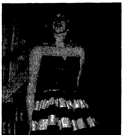
Steffi Graf, miglior giocatrice dell'anno, prova a vincere anche il titolo di miss eleganza

La sua ricchezza ha fatto versare fiumi d'incenso. Il romanzo del giovane povero i primi modesti lavori poi la scalata nel mondo dell'edilizia e via e via. L'informazione, con la rete televisiva e una catena di ristoranti brasserie. Alan Bond della Costa Azzurra è un cliente abituale ed il suo ufficio, per seguire gli affari di mezzo mondo lo ha installato sullo yacht Southern Cross Jessica, di colore bianco panna, definita la più bella imbarcazione solcante i mari in senso assoluto è dotata di 11 vele per un'apertura di 1400 metri quadrati e con venti a forza quattro, sviluppa una velocità di 14 nodi con un massimo di 23. Negli anni passati l'argentino Carlos Perdomo vi portò in crociera ospiti illustri quali Juan Carlos di Spagna. È stata costruita nel 1984 nei cantieri navali di Palma nelle Baleari, su disegno dell'architetto Arthur Holgate. «La più bella barca del mondo» ha 180 maniglie delle sue porte realizzate con denti di balene. Ma Alan Bond pensa anche alle competizioni veliche ed ha ordinato un'imbarcazione maxi con la quale reggerà nel 1989.