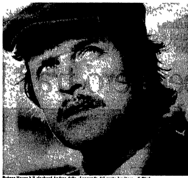
Rutger Hauer è il clochard Andreas della «Leggenda del santo bevitore» di Olmi