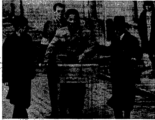
Una scena del film «Angi Vera»

L'ingresso all'Europa costa 7.000 lire, ma per mangiare o anche solo assaggiare la famosa sacher torte, ci vorrà un po' di più. È vero che la torta è austriaca ma gli Asburgo non erano anche i padroni dell'Ungheria?